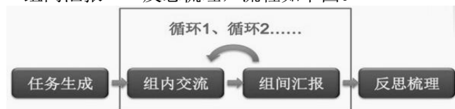
图2 “四段式”自主-合作-支架教学模式流程图

在正式学习方面，各学科贯穿实施自主、合作与支架式教学模式，即“四段式”教学模式，任务生成——组内合作——组间汇报——反思梳理，流程如下图。