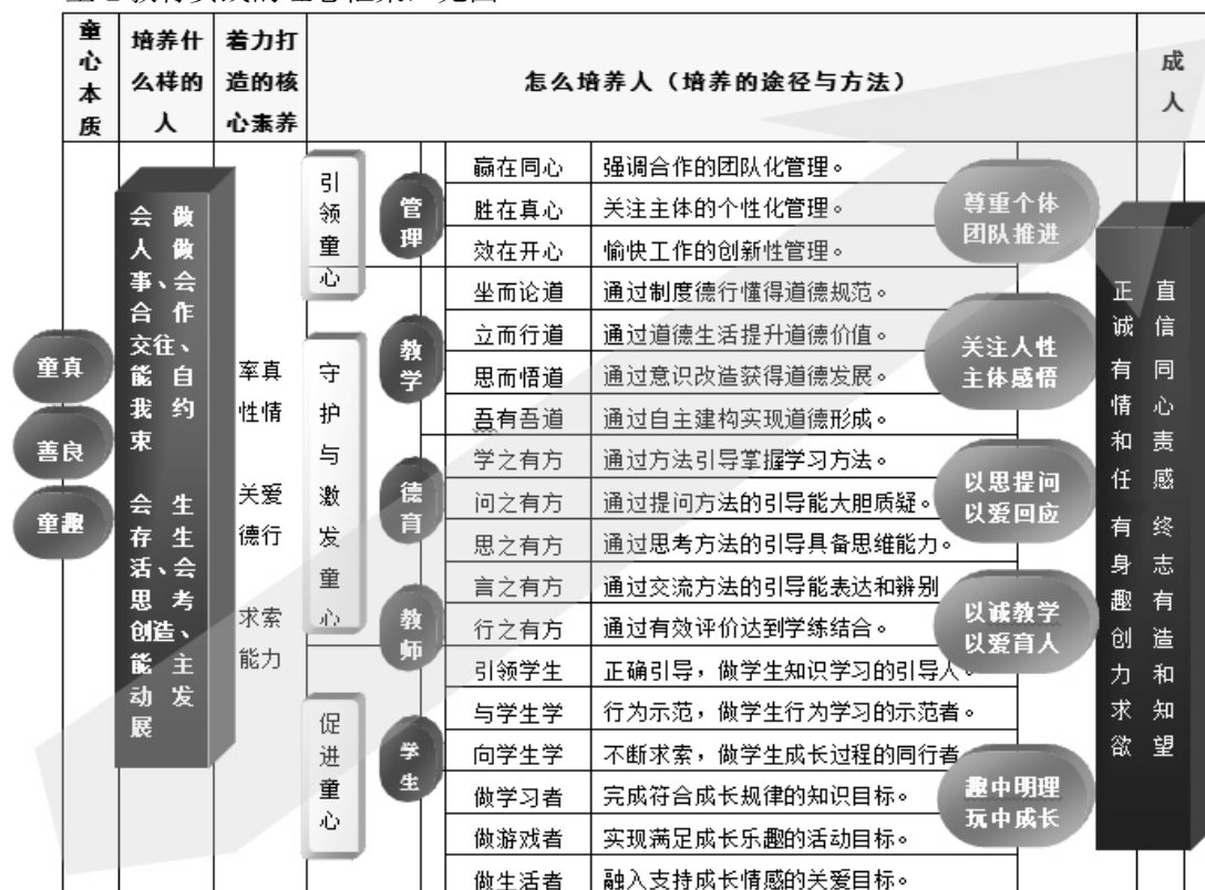
图 2 童心教育实践的理念框架