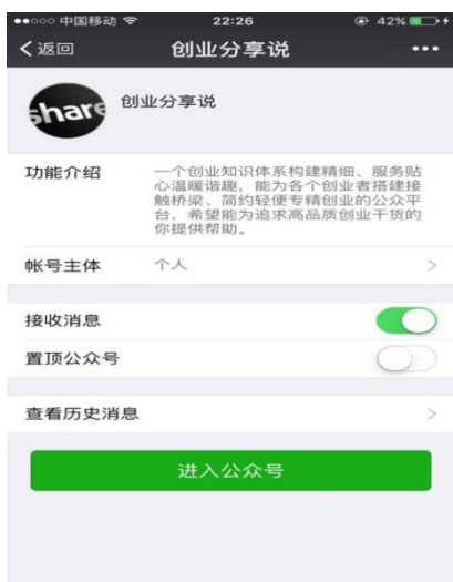
图 3-1 公众号简介

创业分享说是一个为创业者提供服务的平台，平台有着清晰的模块和推送，也会根据关注者在后台的回复做出具有针对性的软文，力求给大家提供高品质的服务（如图 3-1、3-2、3-3）