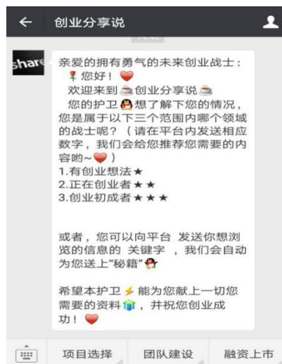
图 3-2 公众号贴心的关注页面