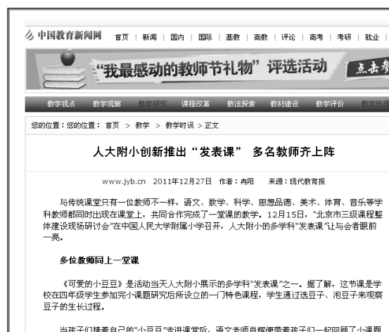
图2 我校校本课程建设的网络截图

6. 2012年6月,我校10节特色校本课程参与了由北京市委组织的BDS录课,取得了良好效果,引起了极大反响。见表4。